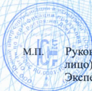
Схема сертификации 1с. Плановый инспекционный контроль - один раз в год. Разрешение на право применения знака соответствия Системы № 00291 от 26.05.2021 г.

М.П. Руководитель (уполномоченное лицо) органа по сертификации Эксперт